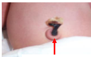
(圖一) 這是寶寶目前的臍帶外觀