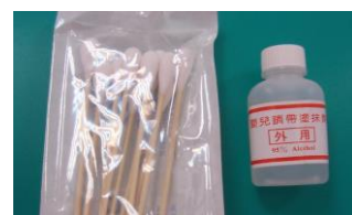
(圖二) 外用 95%酒精，臍帶乾燥用